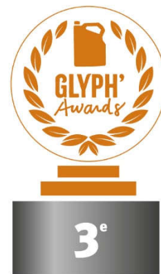
Marne 184 105,33 Kg