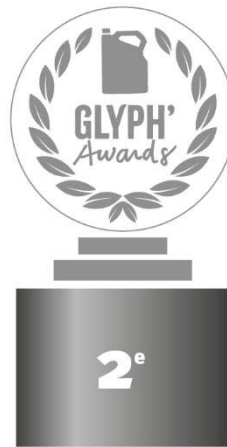
Gironde 185 351,67 Kg