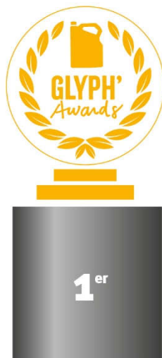
Charente-Maritime 241 058,78 Kg

Notre but : encourager les agriculteurs de ces départements à ne plus jamais vouloir recevoir cette 'distinction' et donc à diminuer ou supprimer leur utilisation de glyphosate.